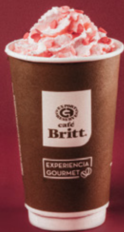
BERRY DELIGHT MOCACCINO $105.00