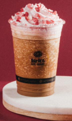
BERRY DELIGHT FRAPPINO $115.00