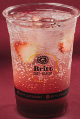
BERRY DELIGHT REFRESHER $105.00